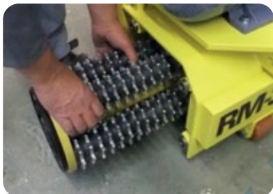
Быстрая замена барабанов и фрез