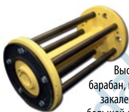
Высококачественный барабан, изготовленный из закаленной стали, имеет большой срок эксплуатации