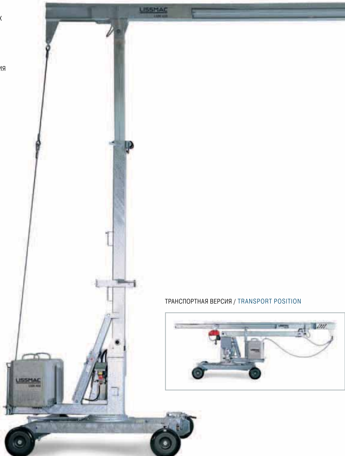
ТРАНСПОРТНАЯ ВЕРСИЯ / TRANSPORT POSITION